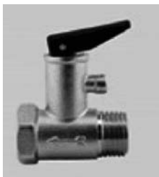
Safety valve with lever Art. VS8BMFML