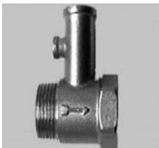
Safety valve without lever Art. VS8BMFM